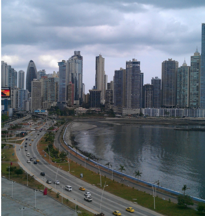
Panamá en la actualidad

Panamá siempre ha sido una ciudad de sonidos. En mi niñez era común escuchar el golpeteo de una moneda al respaldar del asiento, marcando el ritmo de la música que salía de los parlantes instalados en los autobuses. Recuerdo el llamado que hacía una especie de pito utilizado por el afilador de cuchillos. Para tiempos de carnaval, el séquito que acompañaban al resbaloso con botellas y latas que producían música. El chiflido de Chaflán por la Avenida Central. Todo un espectáculo ver a Chaflán, personaje de barrio, de la gente del pueblo.